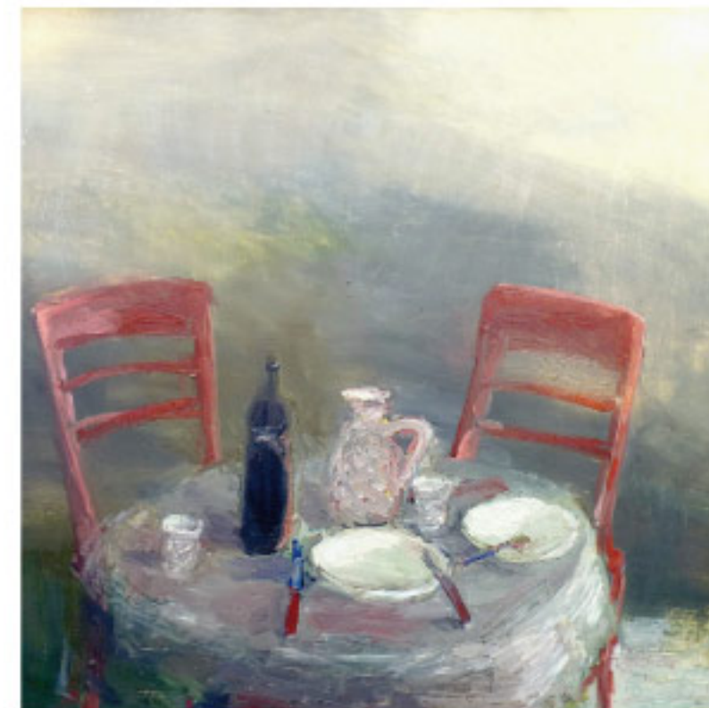
Gerald Müller-Simon, Stilleben, Öl auf Hartfaser, 1991, 90 x 90 cm

Öffnungszeiten Dienstag und Donnerstag 16-19 Uhr Sonn- und Feiertage 15-17 Uhr Ausstellungsdauer: 23.07.-27.08.2017