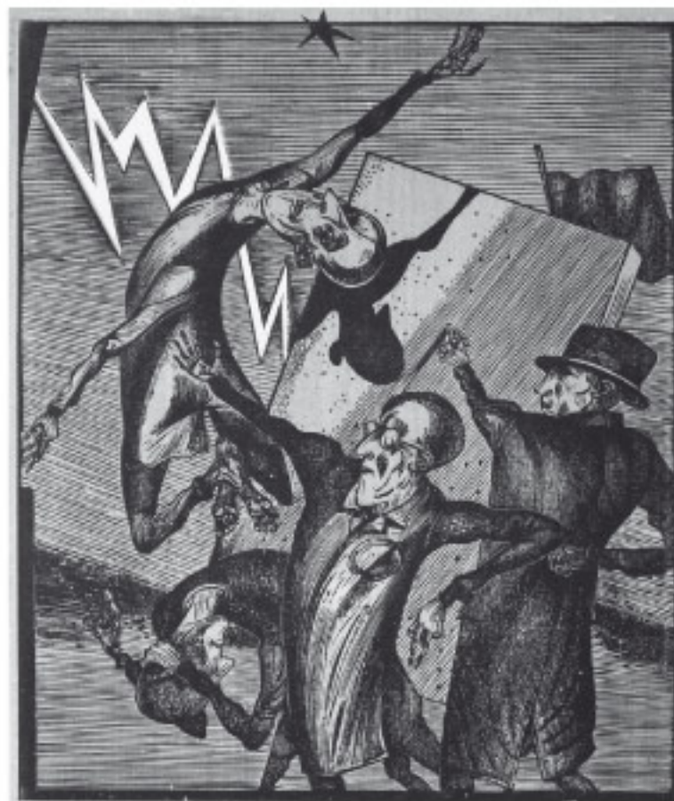
Karl-Georg Hirsch Blitz, Farbholzschnitt, 2015, 34 x 27 cm