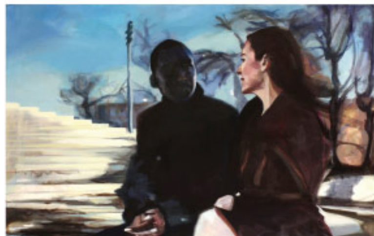
Nicole Kegel Like Lovers Do I, Öl auf Leinwand, 2017, 60 x 110 cm