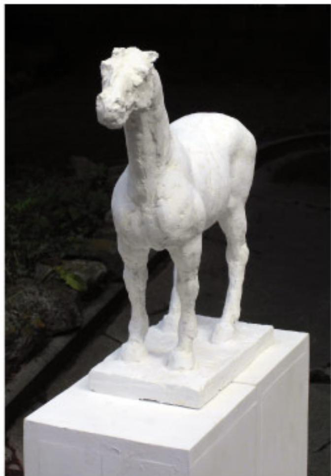
Gunther Bachmann Pferd, Gips, 2017, Höhe 18 cm