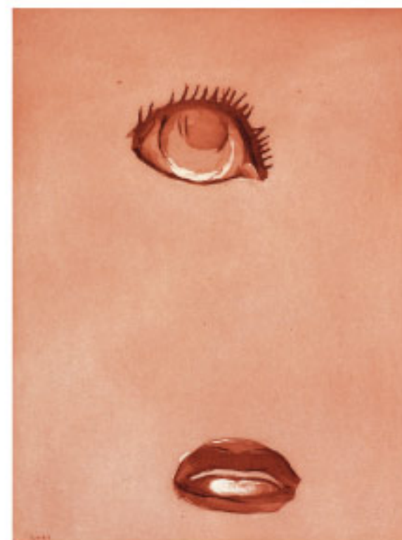
Reinhard Minkewitz Das sonnerhafte Auge, Radierung, 2011, 39,3 x 29,2 cm