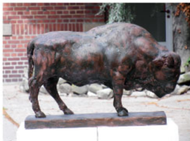
Gunther Bachmann Wisent, Gips bronziert, 2010, Höhe 18 cm