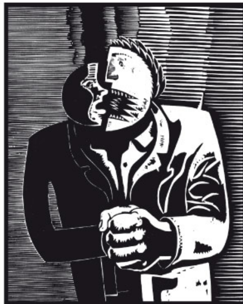
Wolfgang Mattheuer, Zwiespalt, Holzschnitt, 1979, 55 x 45 cm