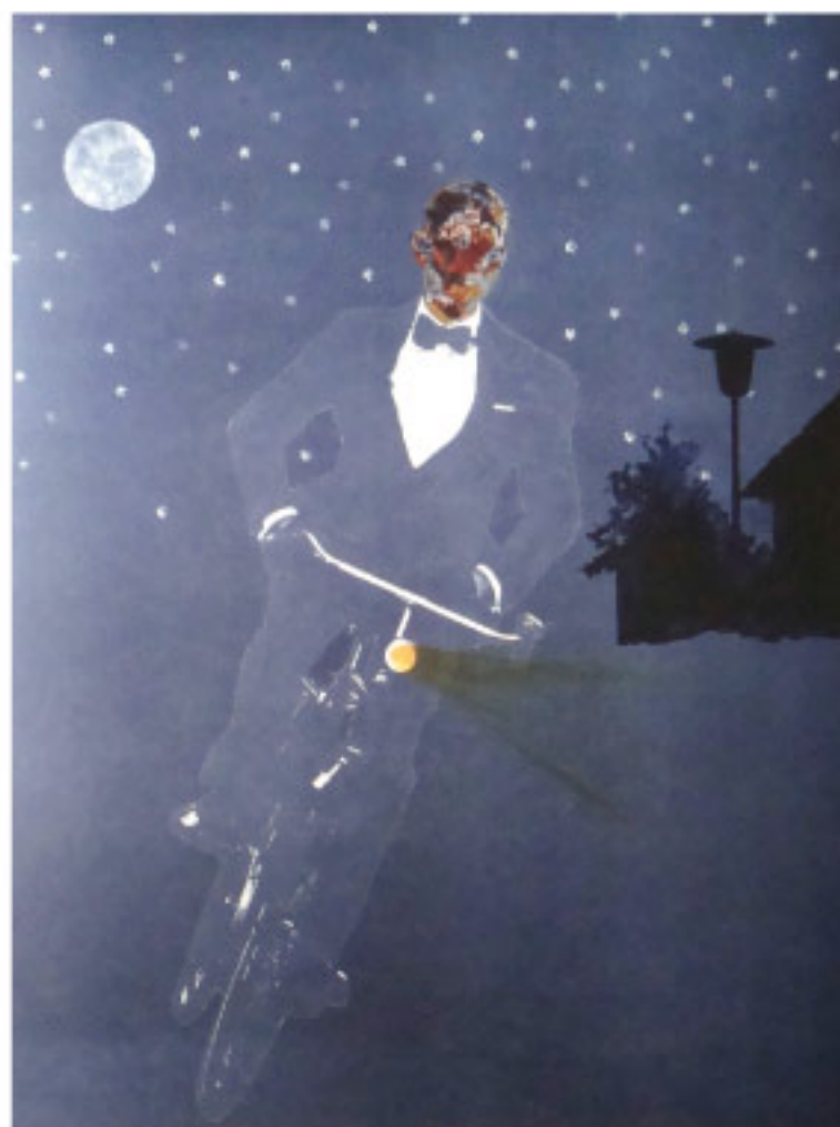
Patrick Fauck Schwarzfahrer, Lichtdruck in 4 Farben, 65 x 46 cm