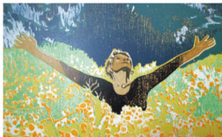
Frank Eißner Yoga is life, Farbholzschnitt auf Karton, 2015, 23 x 33 cm