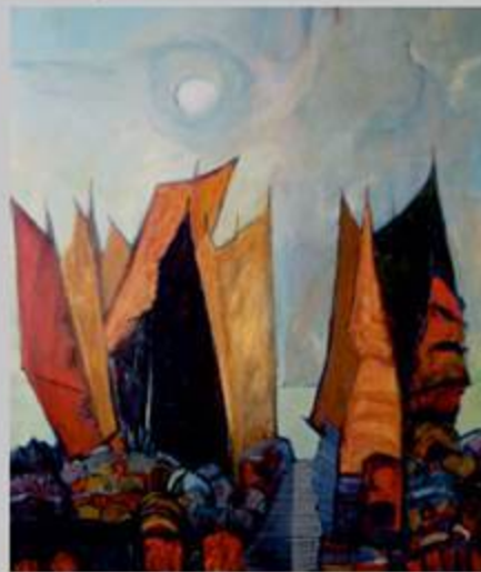
Malerei von Walter Piroch